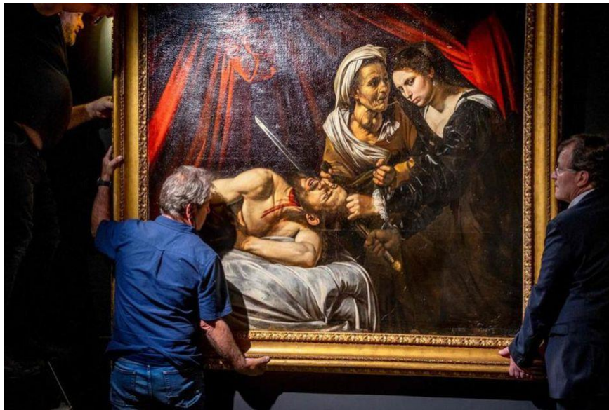
Huile sur toile à Toulouse, copie due à FINSON, d'après Le CARAVAGE