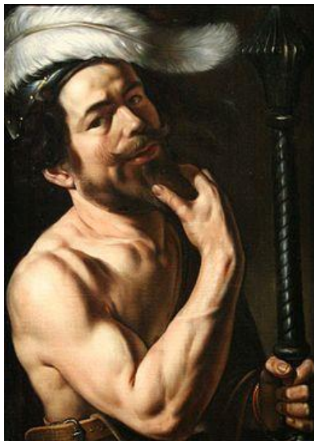
Le peintre FINSON, autoportrait