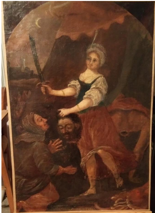
Huile sur toile de J. LEMAIRE, copie vers 1641, Marvejols (Lozère)