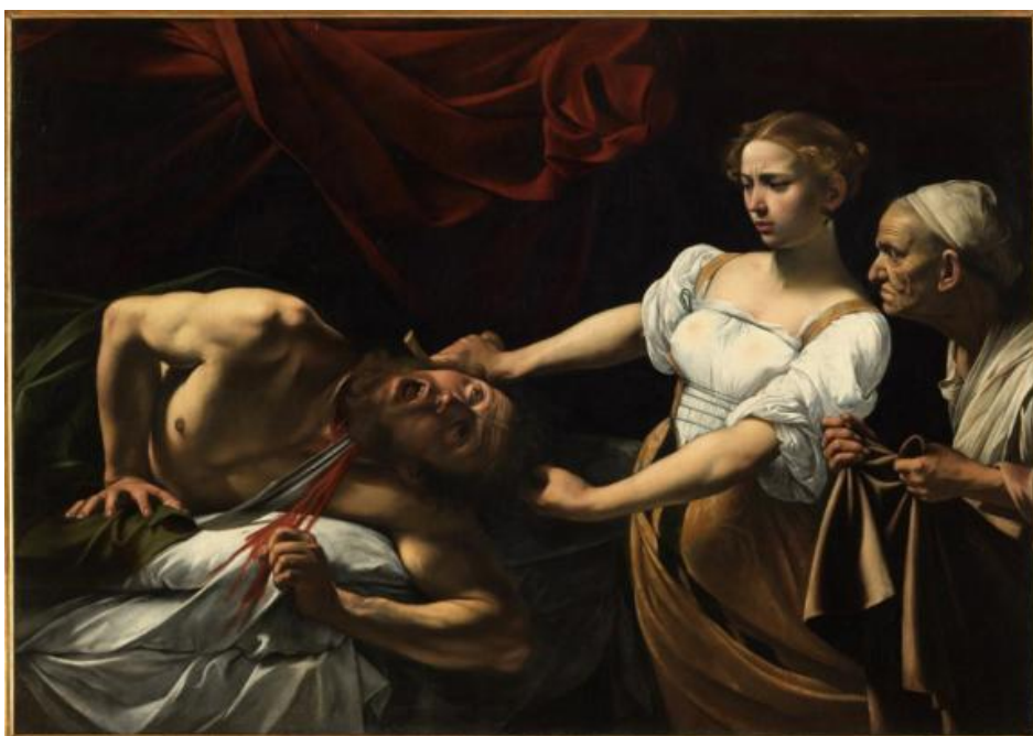
Judith tranchant la tête du général Holopherne, Le CARAVAGE