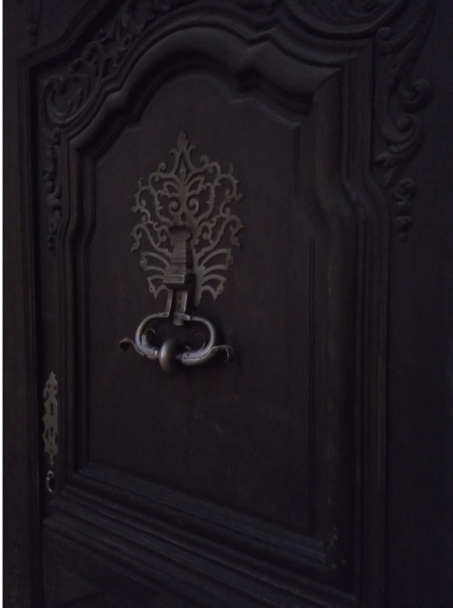
Bordeaux, porte de l'ancienne résidence des jésuites, rue Poquelin-Molière, 2018.